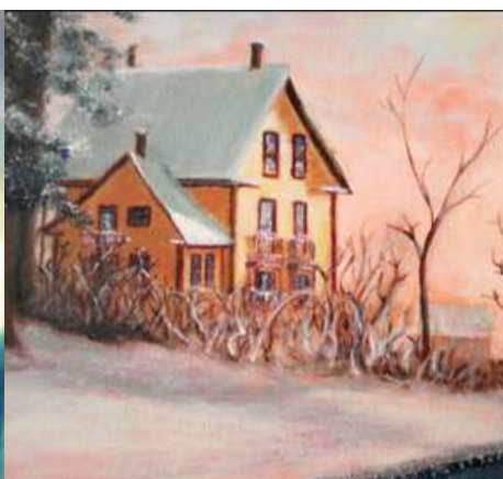
Maison ancestrale 2011