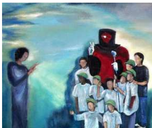
Artistes en herbe 2005